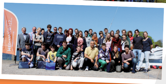
Medienscouts und ihre Ausbilder